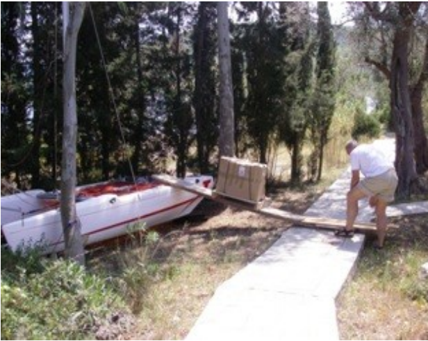
Pejseindsatsen glider ned fra katten til RulleMarie.

Da betonen var størknet installerede jeg ovnen og fik den hævet på plads ved hjælp af nogle taljer. Jeg ved jo alt om den slags, da jeg har set min far udføre disse tricks.