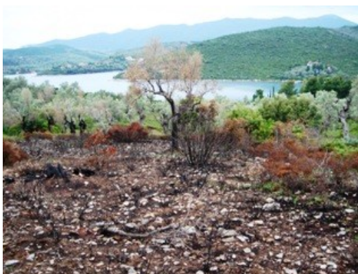
Udsigt næsten fra toppen af vores grund ned mod Petraki