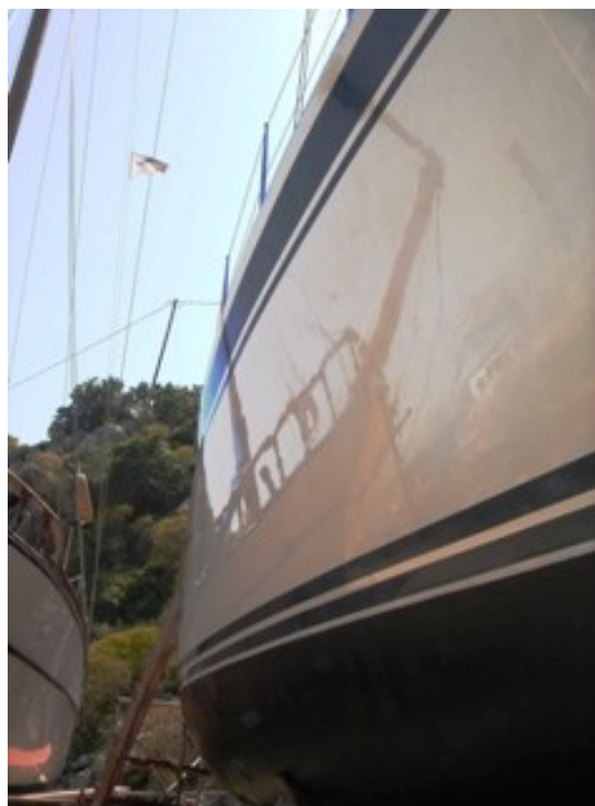
Flot fribord på en 20år gammel båd

Lady M, så ville han gerne købe den. For han havde fortrudt sit køb af en stor motorbåd kaldet Maisi.