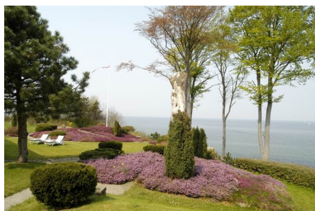
Haven og vandet ved Stonehill