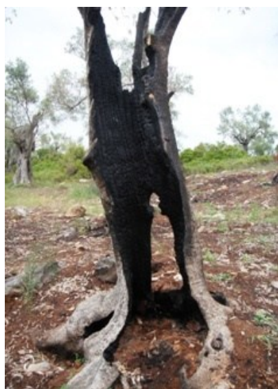
Tal om skorstenseffekt. Vil det overleve?