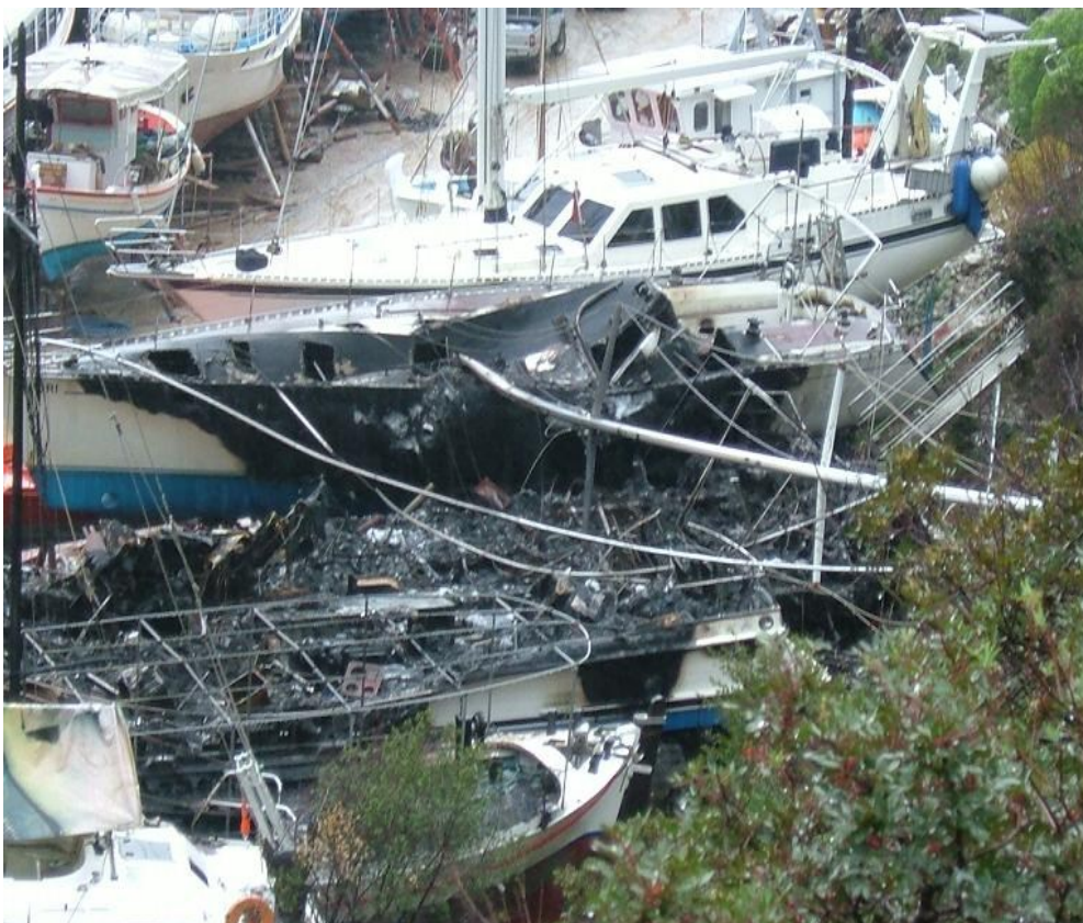
Brandtomten i Kiriaki med Lady M i baggrunden