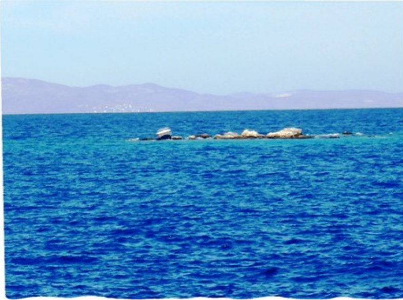
Speedbåden på skæret fotograferet dagen efter. Bemærk hvor heldige de trods alt var, at båden kunne skyde sig op på skæret.

iført badebukser. Jeg sprang ned i Skidtfisken, da Doralen havde visse