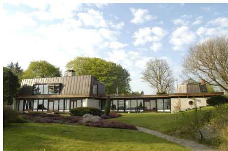
Stonehill i Gilleleje

Der udkom jo ikke så mange numre i 2006. Det har jeg tidligt gjort opmærksom på. Redaktøren har jo også andre gøremål. Desuden skal han have lyst. Alligevel har der været en del ængstelige læsere. Nærmere bestemt to. Det er jo sådan noget, som en redaktør glæder sig over. At man ikke skriver forgæves. Og ja, Petraki News er på banen igen i år.